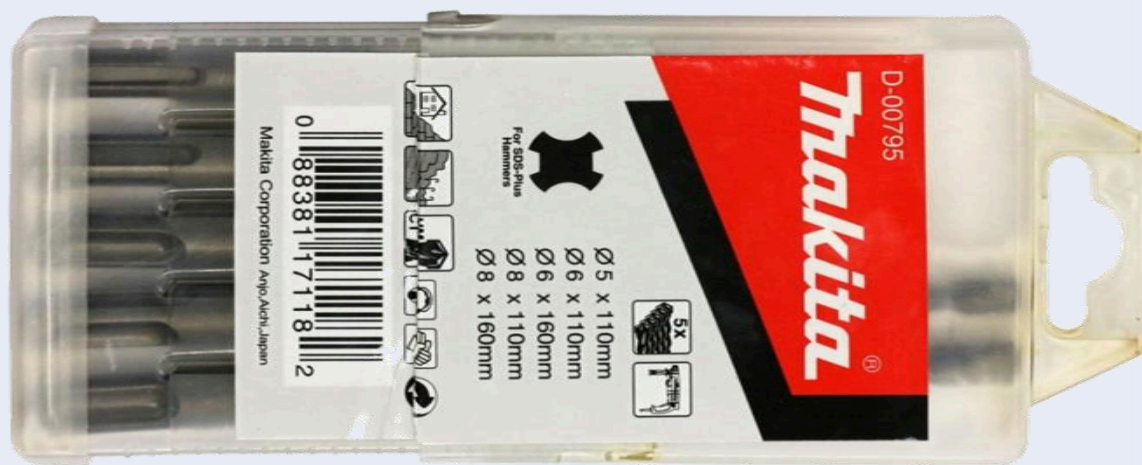
Набор буров из комплектации X5